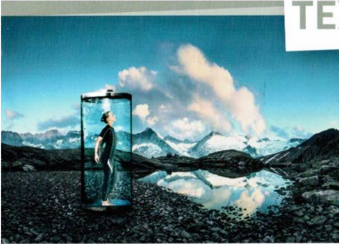
Alle Modelle: Venex Regeneration Wear